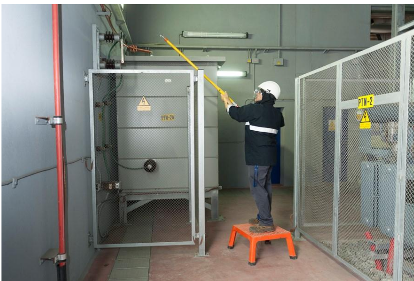
Operario en una maniobra en un centro de distribución.

Las funciones que venía llevando a cabo históricamente el personal propio han pasado en los últimos dos años a manos de contratistas. CCOO pide a la dirección un pronunciamiento claro al respecto.