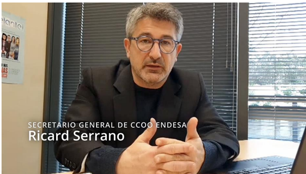
Un momento del vídeo, de dos minutos de duración.